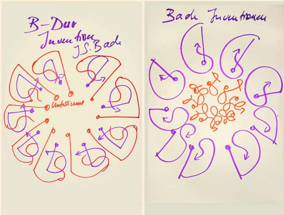
Abb. unten Skizzen zur Choreographie Abb. S. 19 Gruppen- und Szenenfoto