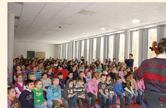
Abb. links: Probe in der Grundschule am Stadtpark Baunatal während der 6. »Nordhessischen Kindermusiktagen mit dem Vogler Quartett« im Jahr 2010