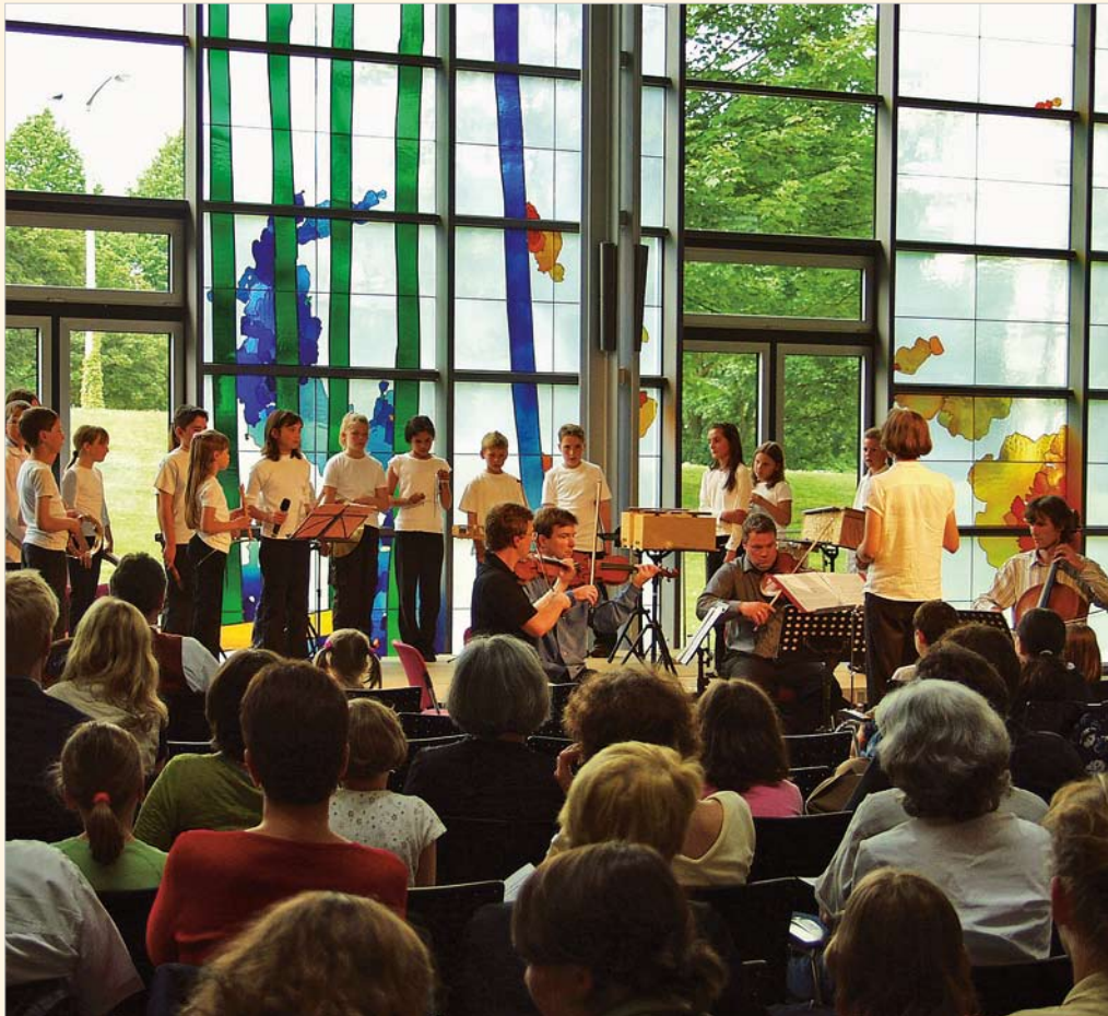
Die ersten Nordhessischen Kindermusiktage mit dem Vogler Quartett zu Gast bei EAM.