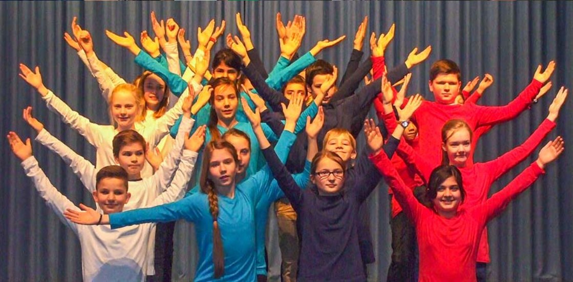
Abb. gegenüberliegende Seite 11. Nordhessischen Kindermusiktage: Eindrücke aus der Projektphase an den Schulen

Ihr Boris Rhein Hessischer Minister für Wissenschaft und Kunst